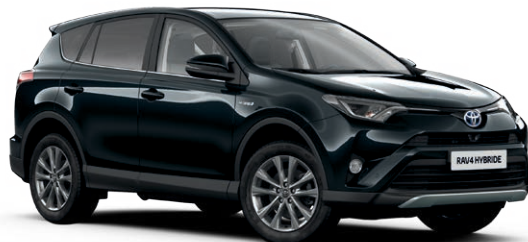
Noir Intense métallisé* (209)