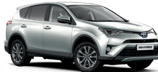
Gris Aluminium métallisé* (1F7)