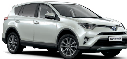
Blanc Nacré* (070)