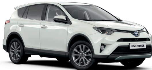
Blanc Pur (040)