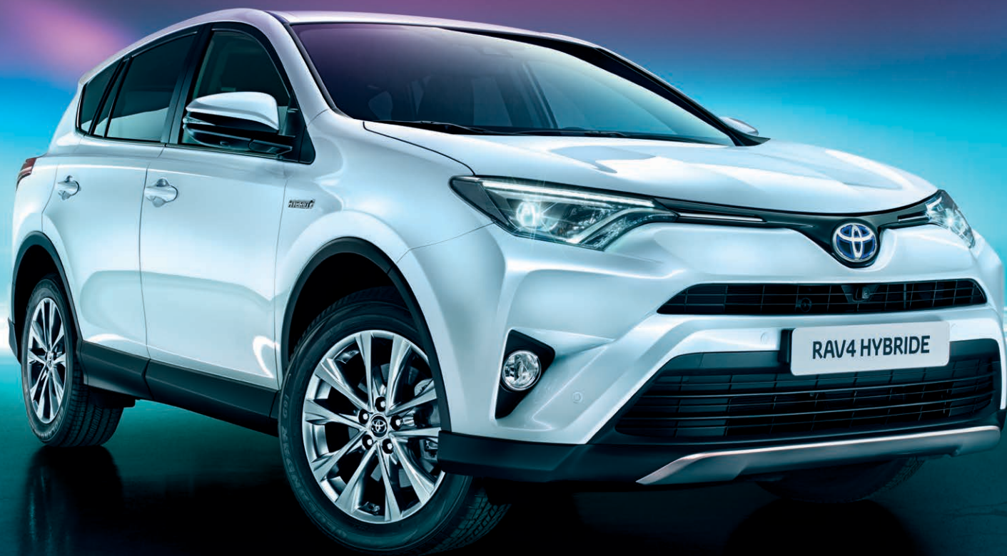
RAV4 Hybride Lounge