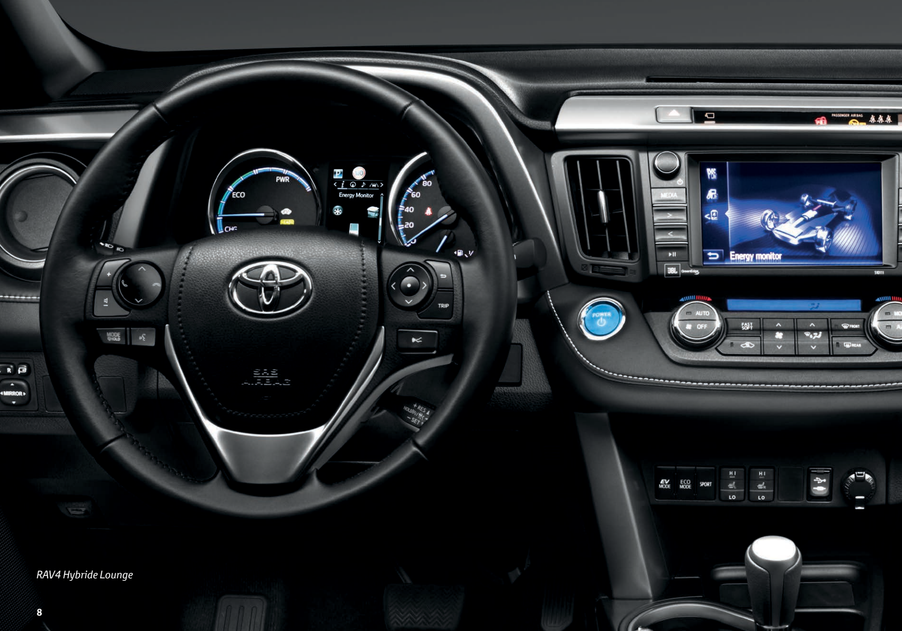
RAV4 Hybride Lounge