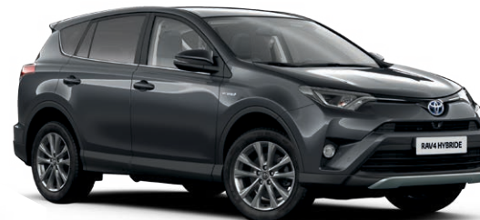
Gris Atlas métallisé* (1G3)