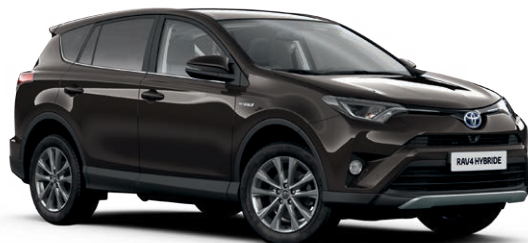
Brun Havane métallisé* (4U5)