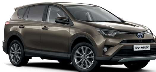
Bronze Clarissimo métallisé* (4T3)