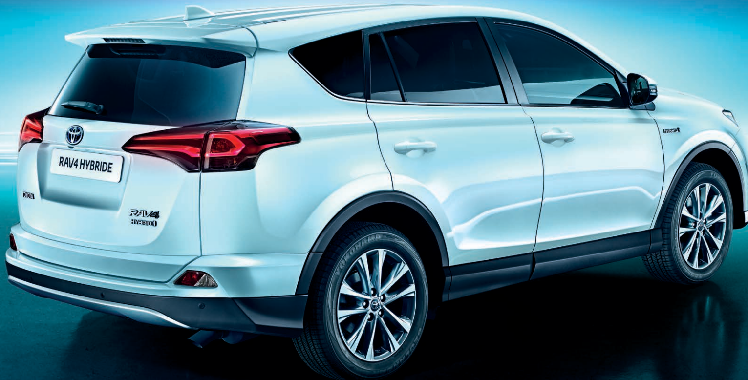
RAV4 Hybride Lounge

Les avantages de la technologie hybride Toyota et la polyvalence du RAV4 se sont associés pour vous proposer plaisir de conduite, puissance et raffinement, tout en garantissant de faibles coûts de fonctionnement et des émissions de CO 2 réduites.