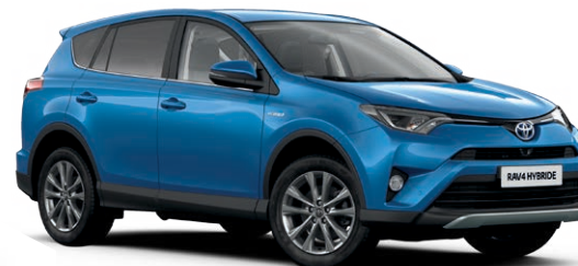
Bleu Électrique métallisé* (8X7)