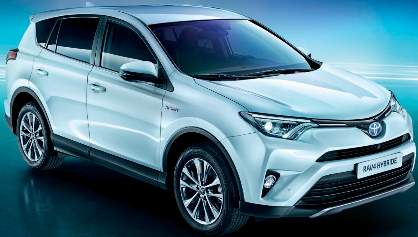
RAV4 Hybride Lounge