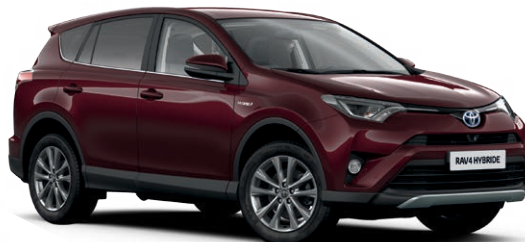
Rouge Pourpre métallisé* (3T0)